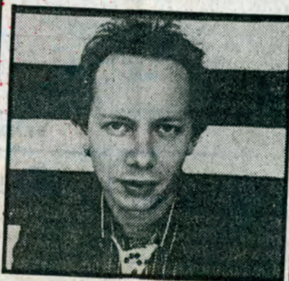
JOE JACKSON, het nieuwe Engelse talent, bekend van de hit Is she really goin' out with him , begint vanavond in de Effenaar te Eindhoven.